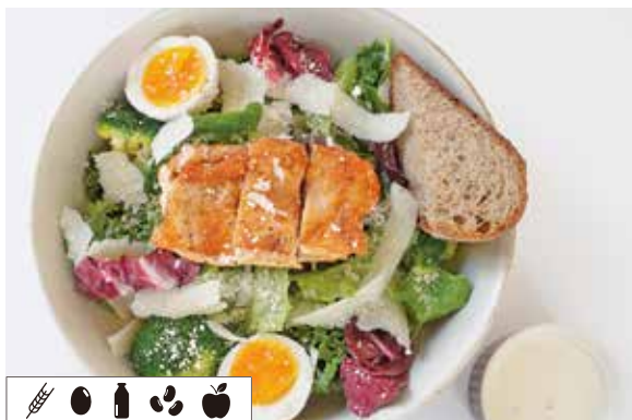
グリルチキンのシーザーサラダ ..... 1,630 GRILLED CHICKEN CAESAR SALAD