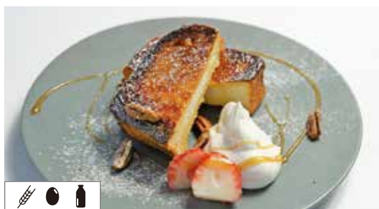
フレンチトースト FRENCH TOAST