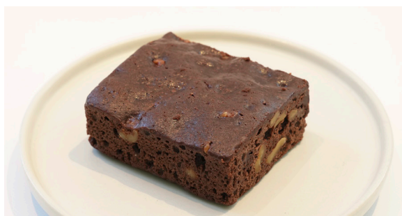
ブラウニー (米粉使用) ..... EAT IN TO GO WALNUT BROWNIE 550 / 540