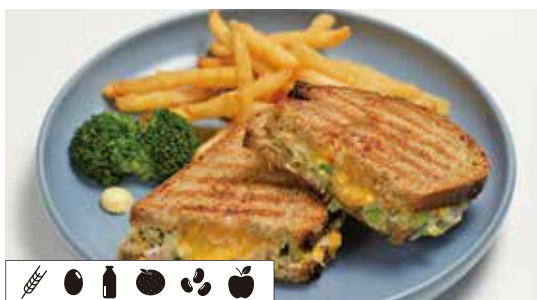
ツナメルトのサンド TUNA MELT SANDWICH