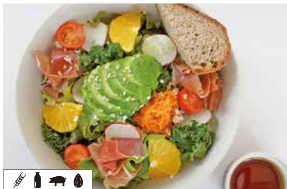
アボカドと生ハムのレモンサラダ ..... 1,650 LEMON SALAD WITH AVOCADO & PROSCIUTTO