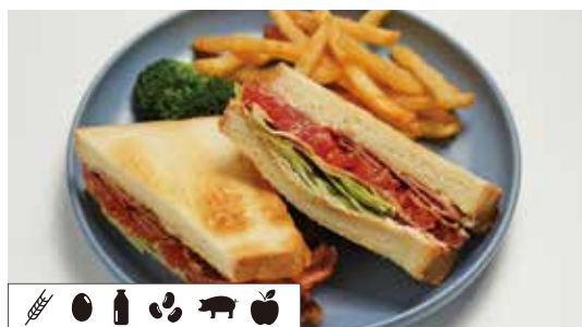
BLTサンド BACON LETTUCE TOMATO SANDWICH