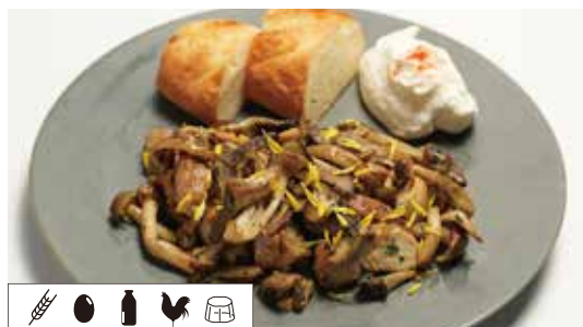
きのこチキンの香草バターソテー MUSHROOM CHICKEN HERB BUTTER SAUTE