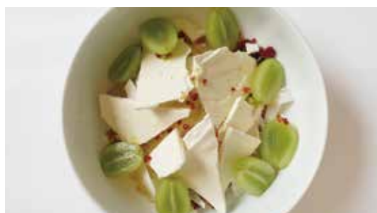
シーズナルフルーツのグreekヨーグルトボウル ..... 1,650 SEASONAL FRUITS GREEK YOGURT BOWL