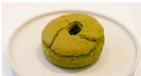
米粉の焼きドーナツ (抹茶) ..... EAT IN TO GO BAKED RICE FLOUR DONUT (MATCHA) 352 / 345