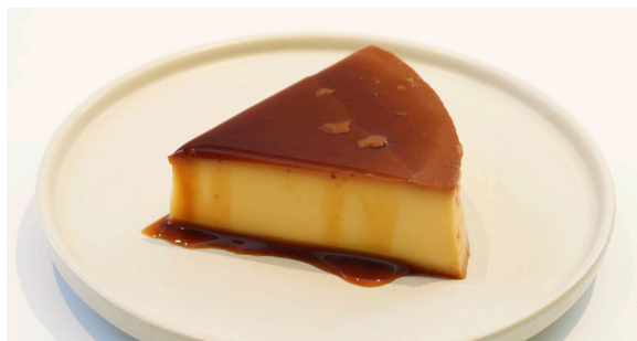
プリン ..... EAT IN TO GO PUDDING 440 / 432