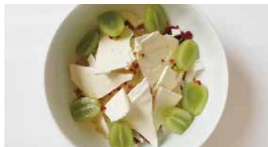
シーズナルフルーツのグreekヨーグルトボウル ..... 1,650 SEASONAL FRUITS GREEK YOGURT BOWL