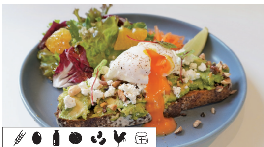
アボカド-toast AVOCADO TOAST Set ..... 1,705 Single ..... 1,430