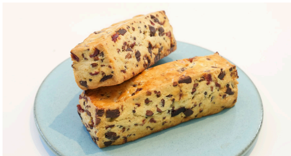
スコーン ..... SCONE