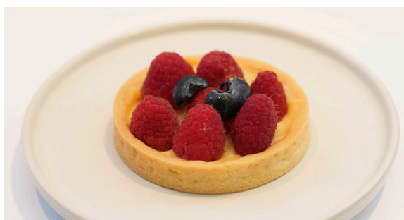
ラズベリータルト ..... EAT IN TO GO RASPBERRY TART 935 / 918