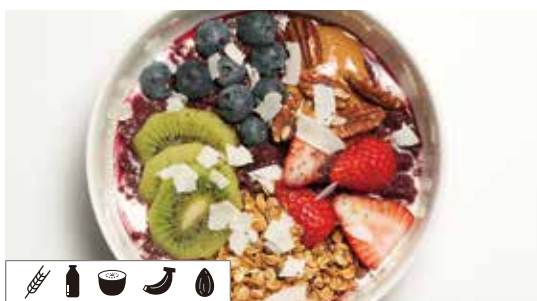
シーズナルフルーツのアサイーボウル ..... 1,705 with マヌカハニー SEASONAL FRUIT ACAI BOWL WITH MANUKA HONEY