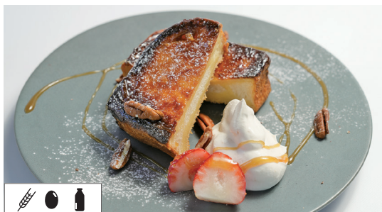
フレンチ-toast FREANCH TOAST Set ..... 1,430 Single ..... 1,155