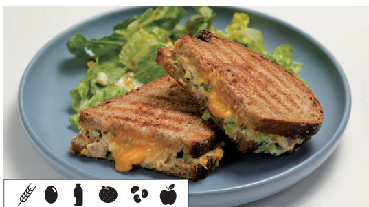
ツナメルトのサンド TUNA MELT SANDWICH Set ..... 1,650 Single ..... 1,375