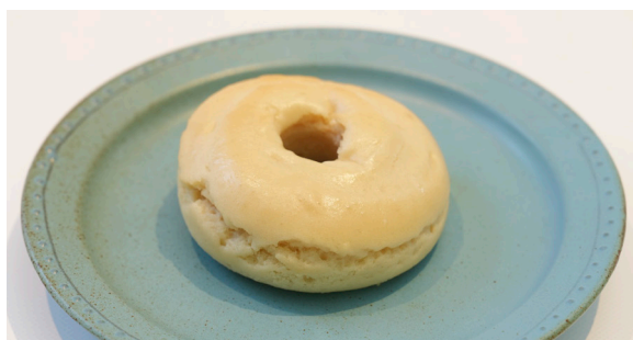
米粉の焼きドーナツ (プレーン) ..... EAT IN TO GO BAKED RICE FLOUR DONUT (PLANE) 330 / 324