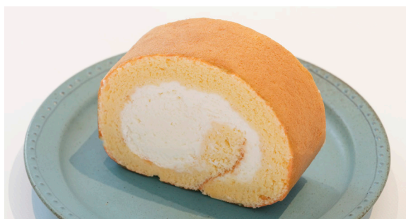
米粉ロール(米粉使用) ..... EAT IN TO GO RICE FLOUR SWISS ROLL 572 / 562