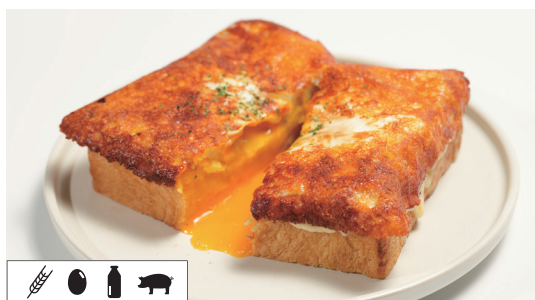
チーズエッグ-toast CHEESE AND EGG TOAST Set ..... 1,430 Single ..... 1,155