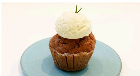
キャロットケーキ ..... EAT IN TO GO CARROT CAKE 462 / 453