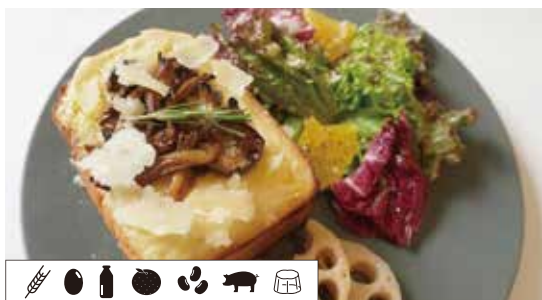
生ハムのクロックムッシュ PROSCIUTTO CROQUE MONSIEUR