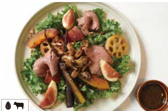
グリル野菜とローストビーフのジンジャーサラダ ..... 1,760 GRILLED VEGETABLES AND ROAST BEEF GINGER SALAD ※グラスフェッドビーフ使用 ※こちらにパンは付きません