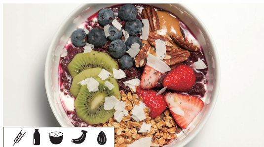
シーズナルフルーツのアサイ ーボウル with マヌカハニー SEASONAL FRUIT ACAI BOWL WITH MANUKA HONEY Set ..... 1,980 Single ..... 1,705