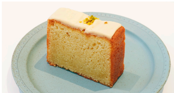
レモンパウンドケーキ(米粉使用) ..... LEMON POUND CAKE