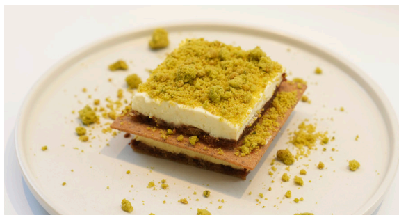
ピスタチオティラミス ..... EAT IN PISTACHIO TIRAMISU 935