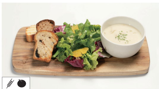
ミニスーププレート <スープ + パン + サラダ> MINI SIZE SOUP PLATE Set ..... 1,485 Single ..... 1,210